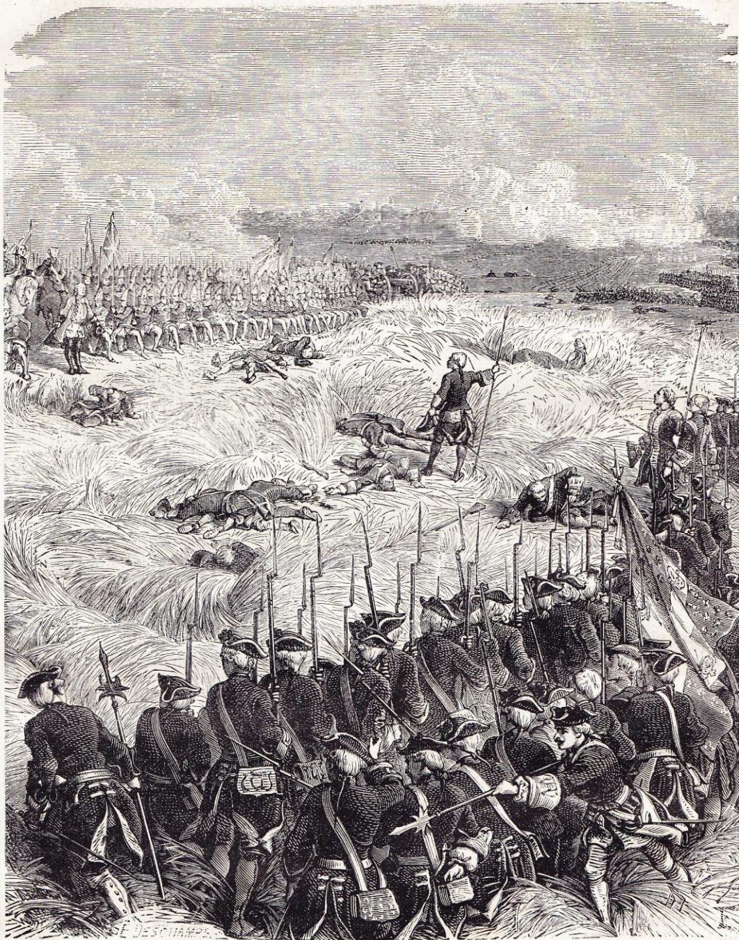
Bataille de Fontenoy (11 mai 1745).

Il était homme à le faire; aussi on lui accorda ce qu'il voulut (janvier 1743).