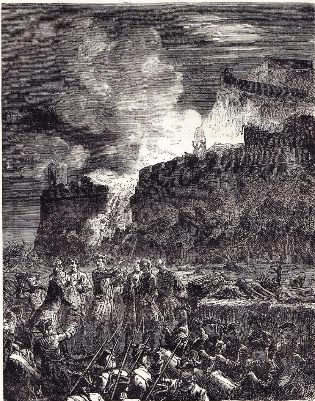
Prise de Port-Mahon (1756).

en conçut une jalousie qui lui fit chercher une occasion de rupture.